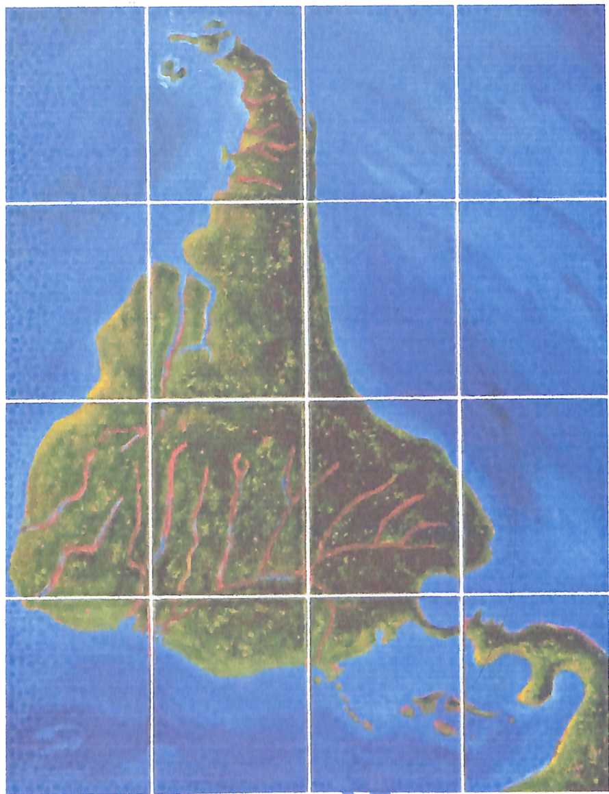
García Urriburu - Sur Fragmentado

Óleo sobre tela 170 x 130 cm. 16 módulos de 40 x 30 cm - Buenos Aires - 1992