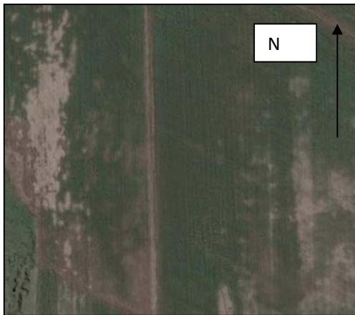
Fig. N°2. Erosión en manto en predios. Cuenca Arroyo del Gato. 2007