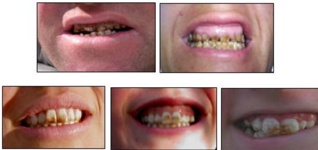
Fig. N°8. Fluorosis dental en adultos 2008

Con respecto a la aptitud para el uso humano, del tratamiento de la información y utilizando los límites establecidos por el Código Alimentario Argentino (CAA), se desprende que del total de las 20 muestras extraídas y analizadas el 100% no son aptas para consumo humano por su alto contenidos en Arsénico, Flúor o en Nitratos.