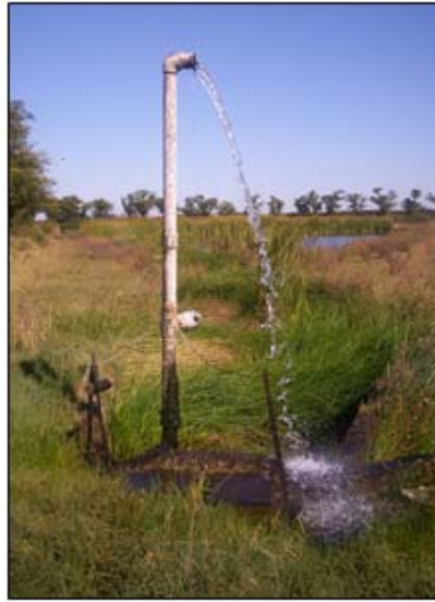
Fig. N° 9. Pozo surgente Chacra La Isabel

Es decir que la muestra del surgente de la Chacra la Isabel, procedente de un acuífero confinado resultó ser agua dulce, dura y bicarbonatada- sulfatada sódica y apta para consumo humano, por lo que este recurso hídrico perteneciente al acuífero confinado (cercano a la localidad de Malena), sería una alternativa para mejorar la calidad del agua que utiliza la población de la localidad.