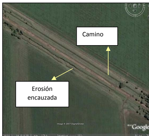
Fig. N°4. Erosión en caminos rurales de Malena. 2007