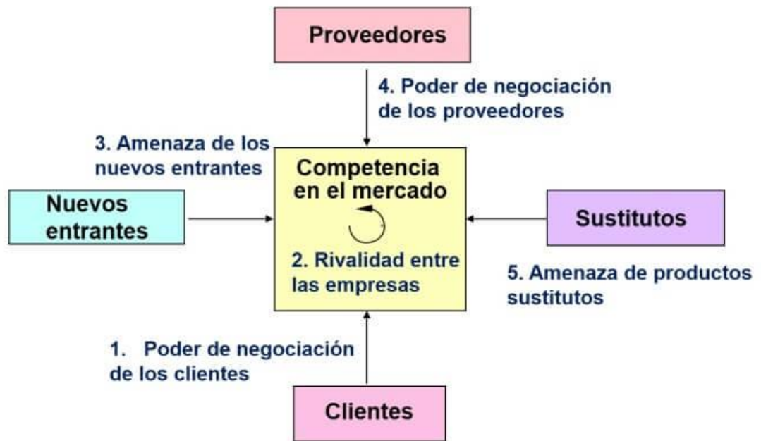
Tabla 8: 5 fuerzas de Porter