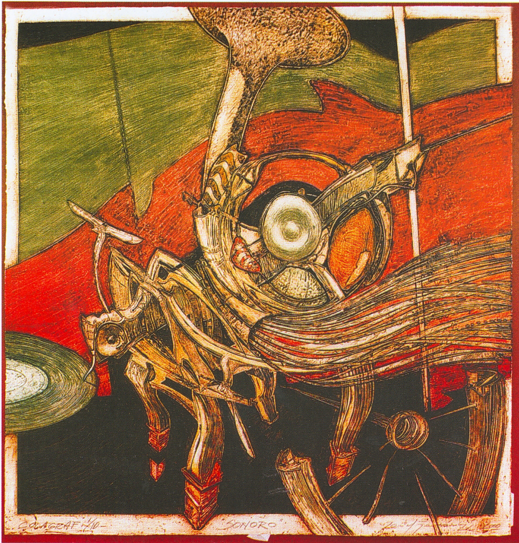
Sonoro Colagraf 2000