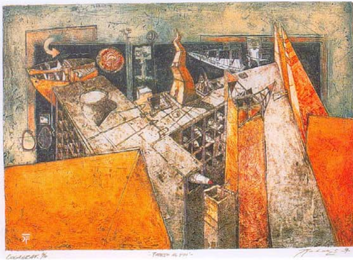
Puerto al fin, 1994 Colagraf 58 x 89 cm Primer Premio Adquisición XXX Salón Nacional de Grabado y Dibujo (San Luis 1994)