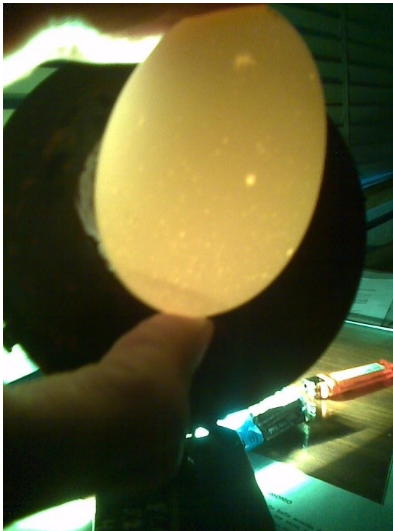
Cámara de aire observada a través del ovoscopio.

Fuente: Caracterización de Parámetros de Calidad de Huevos Frescos Comercializados en el Gran Mendoza (Argentina). Spadoni, et al. (9).