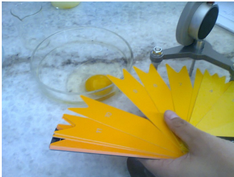
Escala ROCHE para comparar color de yema de huevo.