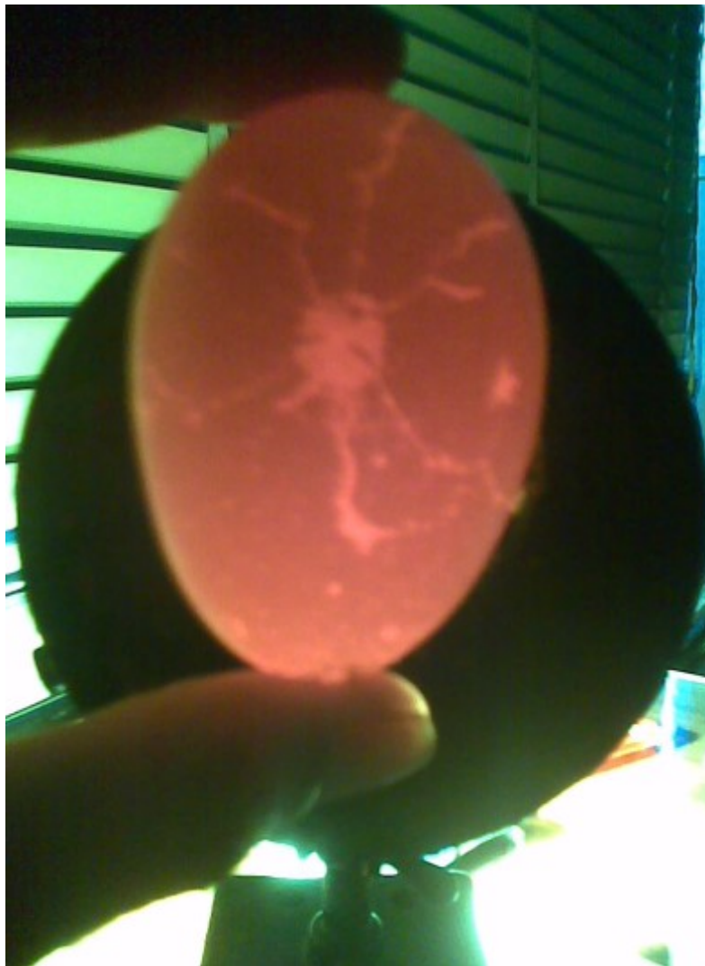
Observación de una rajadura “en estrella” en Ovoscopio.