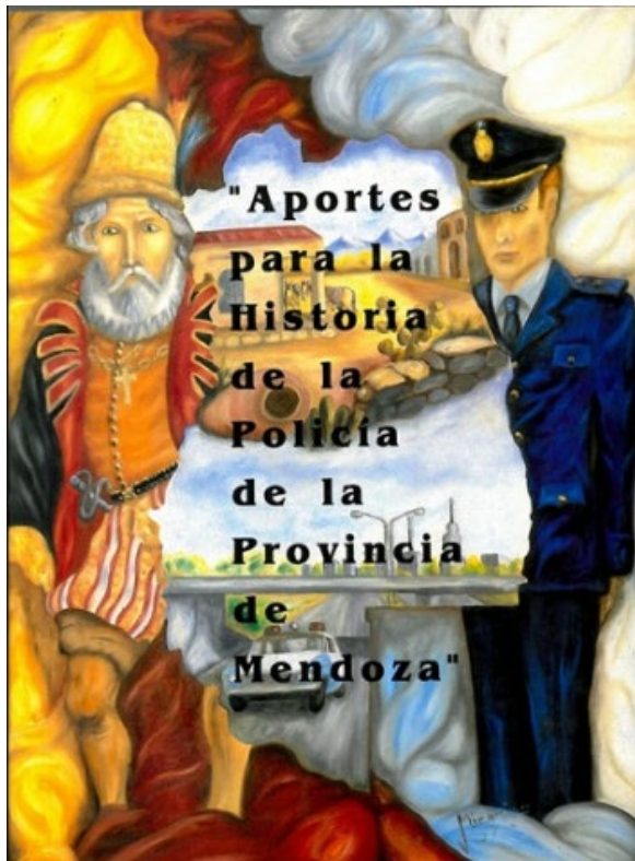
Imagen 1: Tapa del libro Aportes para la Historia de la Policía de la Provincia de Mendoza