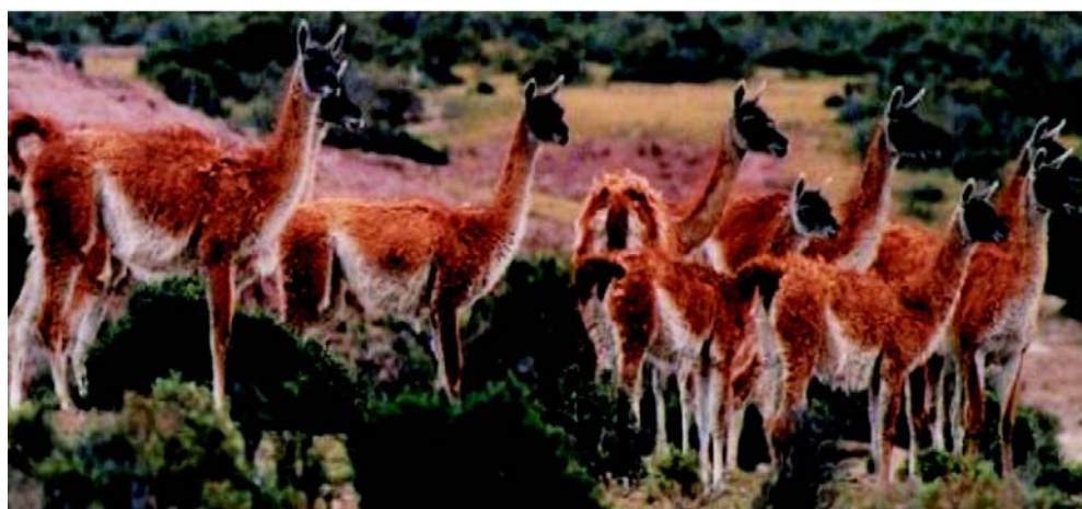
Fig. N° 2