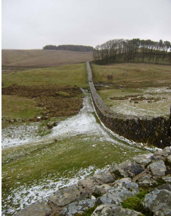
Foto 1. Muro de Adriano, “limes” norte do Império Romano (atual Inglaterra) construído por volta de II d.C. (2010)

Esse controle da circulação pode se dar sob um arremedo de confinamento de ordem mais simbólica, em rede, pela produção de circuitos relativamente isolados (como os de alguns grupos culturalmente mais fechados dentro de diásporas migratórias), sob a forma mais concreta de muros que funcionam como barragens ou “diques” e, finalmente, por meio de dutos materiais, numa espécie de canalização desses fluxos em vias de grande circulação (como analisamos em Haesbaert, 2013, para o caso do Rio de Janeiro). Nesse sentido, uma das estratégias aparentemente mais anacrônicas, hoje em dia, é a construção de novos muros – desde o nível da propriedade privada e de bairros etnicamente segregados (como em bairros ciganos na Europa oriental) até os muros transfronteiriços, como o emblemático muro da fronteira entre