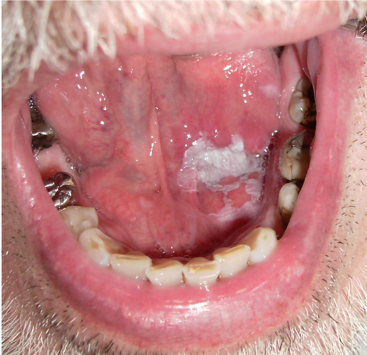
Figura 1: Placa blanquecina de superficie rugosa que compromete cara ventral de la lengua y piso de boca.